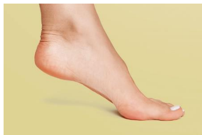
FOOT PLURAL = FEET